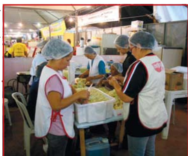
A equipe na preparação dos yakissobas na Festa do ovo