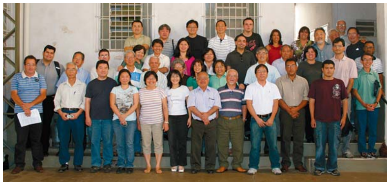
2ª Região: pastores, representantes das igrejas e membros da DC

Entre as atividades conjuntas, a 2ª Caravana Evangélica foi a que recebeu mais avaliações positivas.