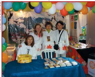
Equipe barraca de pesca em Curitiba