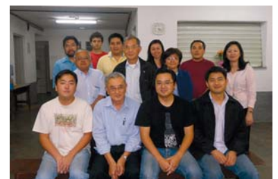
Diretoria eleita do Projeto Aba