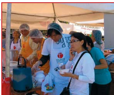
Festival da amizade: irmãos da igreja preparando as refeições