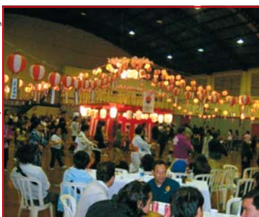
Praça de alimentação do Bon-Odori de Bauru