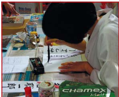
Stand de oração e escrita de nomes em japonês em Curitiba