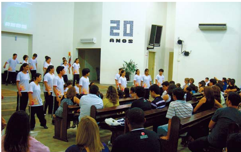
Apresentação do grupo Amart no aniversário da Igreja de Tangará