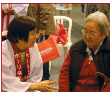
Voluntária Holiness em conversa com idosa no Festival do Japão